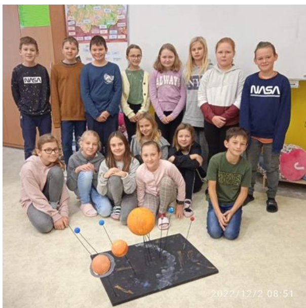
autor článku: Nicolas Koudelka

Výtvarku jsme si užili, byla to jiná hodina než ostatní. Byla akční a poučná zároveň. Věřím, že náš model sluneční soustavy bude přínosem i pro jiné třídy.