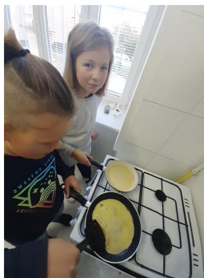
autor článku: kolektiv autorů