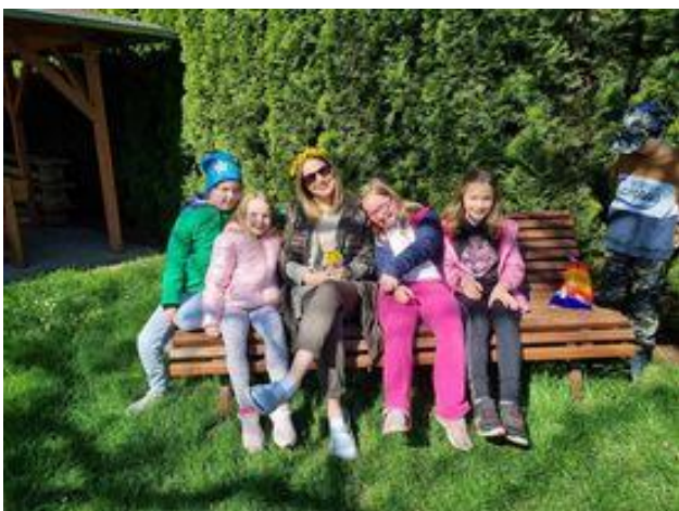
autor článku: Veronika Baťková

Moc děkuji všem animátorům, paním učitel- kám a zrycho- vatelkám se se nás postarali.