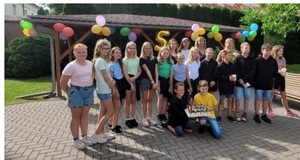
autor článku: Lucie Antlová

jsme si připravili dvě vzpomínková videa, letní tanec a píseň na rozloučení. Maminka paní Lichnovská nám upekla krásný dort, který jsme rozkrájeli a nabídli všem učitelům a rodičům. Další maminky se domluvíly a přinesly nám občerstvení, které jsme uvítali. Hlavně přinesly ovoce, které jsme v horku hned snědli. Na konci posezení přišel očekávaný okamžik, dostali jsme krásné černé mikiny s logem ABSOLVENT 1. STUPNĚ 2023 .