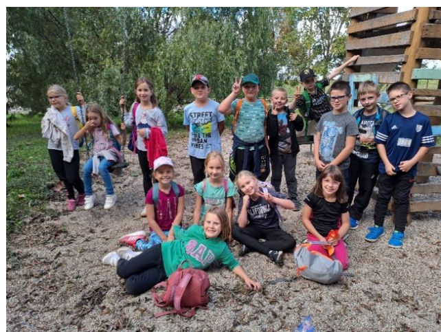
autorka článku: Leona Zemánková

Celoroční námořnická plavba je tedy plná napětí, vzrušení a samozřejmě zábavy. Ať už se děti zúčastní jen jedné výpravy, nebo se vydají na celou plavbu, jistě si odnesou spoustu skvělých zážitků a naučí se důležitým hodnotám, jako je spolupráce, zodpovědnost a kamarádství.