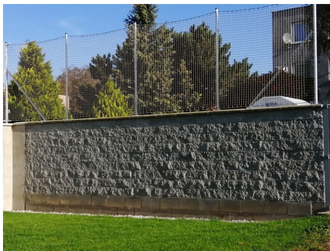
stěny jsou opatřeny ochrannými sítěmi

Materiální vybavení školy je dle finančních možností postupně modernizováno a doplňováno.