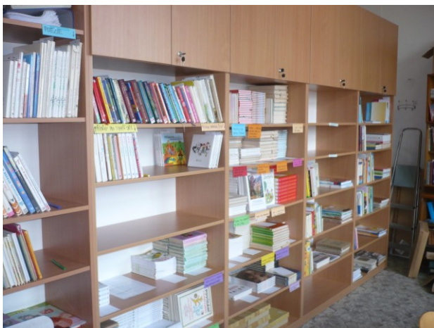
školní knihovna pro žáky a učitele