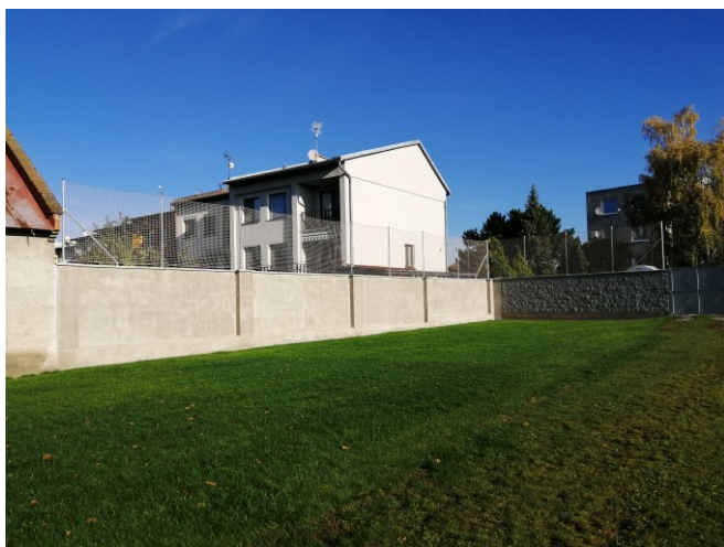
travnaté hřiště na školním dvoře

Zpestřením pro děti je velká trampolína. Na školní zahradě se nachází také dřevěný altán, který slouží k výuce žáků v prostředí školní zahrady.